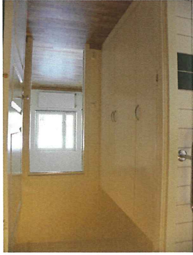
Klädkammare mot sovrum